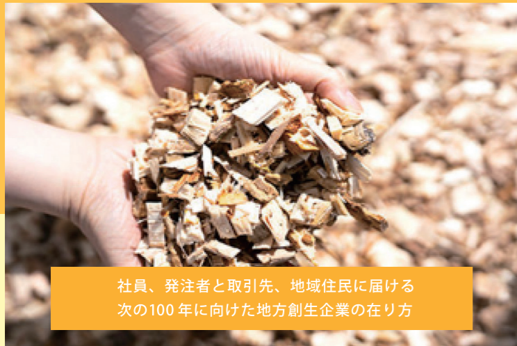
社員、発注者と取引先、地域住民に届ける次の100年に向けた地方創生企業の在り方