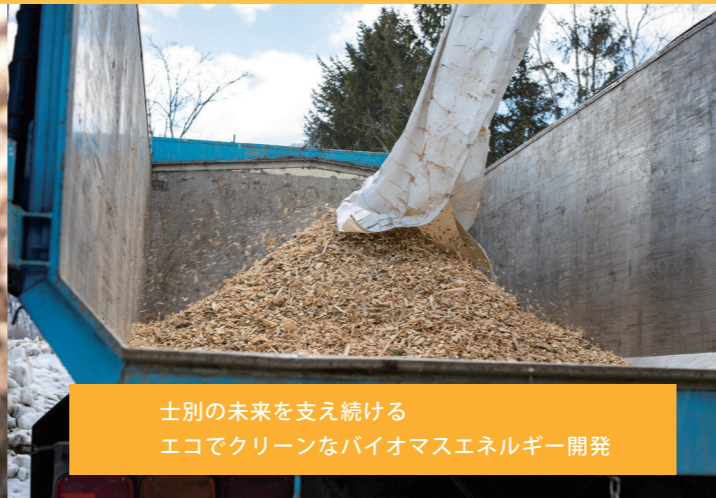
土別の未来を支え続けるエコでクリーンなバイオマスエネルギー開発