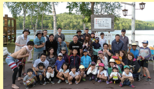
※キャンプでの家族集合写真